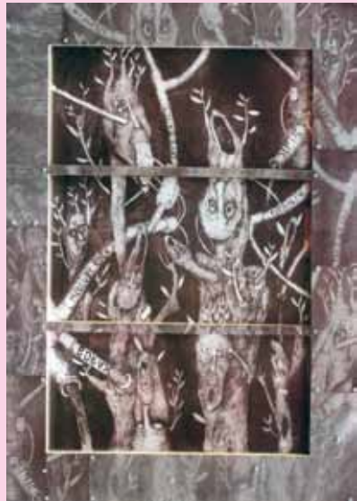
Pemenang II Tumbuh dan Terkontaminasi II, 2006 Intaglio, tinta cetak di atas kertas, 113 x 83 cm Karya : Agus Prasetyo