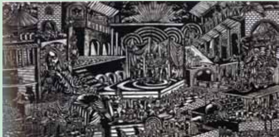
Pemenang II Renungan dalam Kontradiksi, 2002 Hardboard Cut, 132 x 250 cm Karya : Agus Yulianto