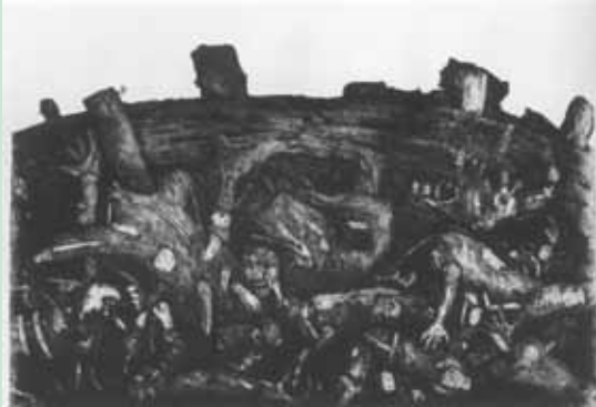
Pemenang I Manusia Rongsokan, 2003 Intaglio, 55 x 90 cm Karya : Agus Prasetyo