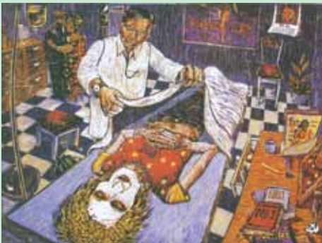
Pemenang III Mati Tersenyum, 2003 Cukil Hardboard, 45 x 60 cm Karya : Sri Maryanto