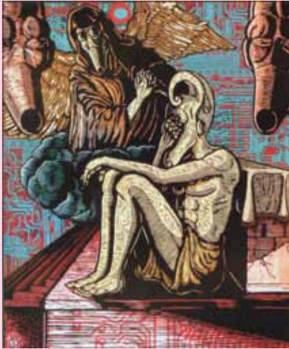
Pemenang I Hegemoni Teknologi, 2006 Cetak digital di atas kanvas, 100 x 85 cm Karya : A.C. Andre Tanama